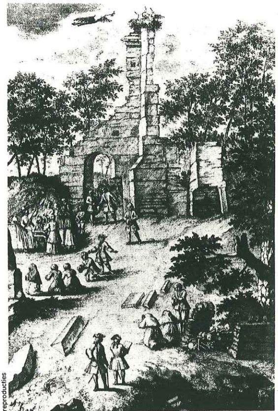
• De ruïne van Eik en Duinen met bedevaartgangers en, links, een begrafenist. De tekening werd in 1729 gemaakt.

Oud Eik en Duinen zag kans de concurrent het hoofd te bieden. Diverse keren werd overgegaan tot een uitbreiding; mensen van alle gezindten kunnen er worden begraven. Begin jaren zeventig leek de toekomst