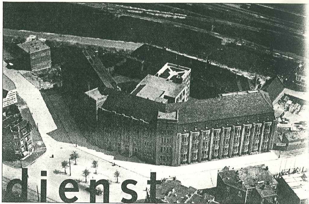
Gebouw Spaarneplein voor de verbouwing, 1937