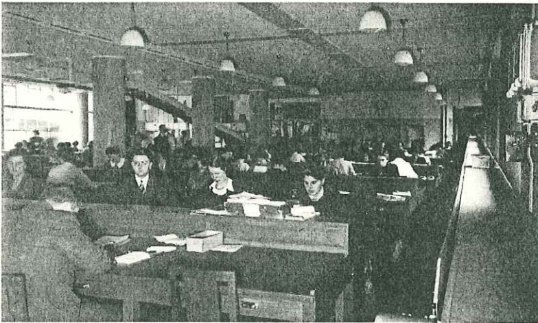
Afdeling Aankomst en Expeditie in het nieuwe gebouw, 1938

In een plateelfabriek Toen de Postchèque- en Girodienst in 1918 werd opgericht was het pand aan het Spaarneplein er nog niet. De 'Giro' had zo'n pand ook niet nodig, de opdrachten van de 4000 rekeninghouders werden die eerste jaren verwerkt op de plaatselijke postkantoren. In Den Haag werden alle betalingen daarna nog