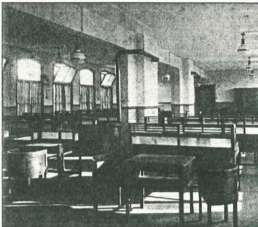
Een rekening-courantzaal in 1918

Toen het aantal rekeninghouders groeide, bleek die decentrale verwerking niet handig te zijn. De directie van de PCGD besloot om de hele administratie in Den Haag te concentreren. Daardoor waren meer medewerkers nodig en was het pand aan de Zuid-Binnen-Singel al gauw te klein. Om onduidelijke reden was een splinternieuw groot pand beschikbaar; aan het Spaarneplein had de Rijksgebouwendienst in 1922 een groot gebouw neer laten zetten voor de Octrooiraad. De Raad trok er echter niet in en het werd aan de PCGD toegewezen.