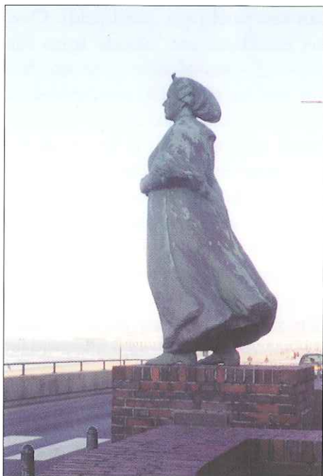
Vissersvrouw te Scheveningen

klokken sedert 1975. Ter vergelijking: het carillon van de Haagse Grote of Sint Jacobskerk heeft er slechts 10 meer – 47 –, waarbij vermelding verdient dat het merendeel daarvan afkomstig is van de koninklijke en klokkengietende firma IJsbouts te Asten. En het toeval wil dat ook de voor de toren staande bronzen vrouw in klederdracht door deze firma is gegoten.