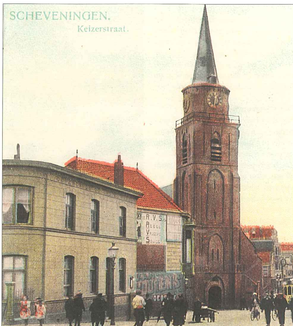
Toren begin 20e eeuw. Vanaf de kop van de Keizerstraat

Geen toren zonder kerk. Het belendende kerkgebouw – gotisch en driebeukig schip – dateert ergens vanuit de tweede helft van de 15e eeuw. Toen zijn de Scheveningers een eigen kerk gaan bouwen – zij moesten in de Grote Sint Jacob ter kerke – en dat zou dan moeten zijn geweest ter gelegenheid van de verzelfstandiging in 1466 – dit jaar dus ook al weer 535 jaar geleden – tot eigen parochie. Hardnekkige legende is dat de huidige kerk de opvolger is van een eerder