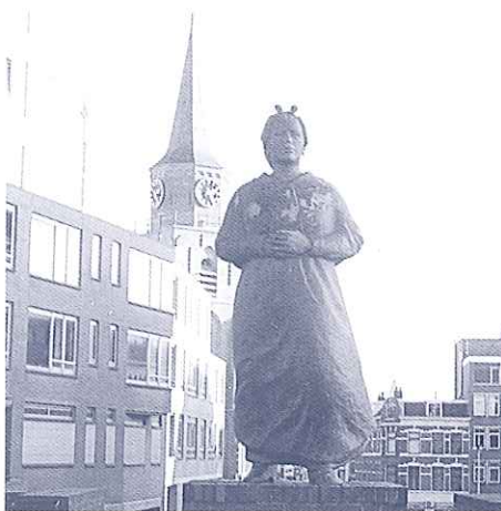
Toren en beeld te Scheveningen

ook een beeld van de essentialia van de Scheveningse klederdracht: het hoofdjizer, de omslagdoek en de door de zeewind altoos naar achteren en dus landinwaarts waiende rok. Wij lopen geen grote kans meer om tijdens onze korte wandeling een heuse vrouw in de klederdracht van Scheveningen te ontmoeten. Blijkens een re-