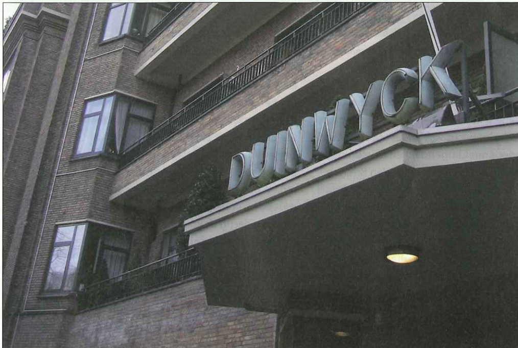
Hoofdingang Duinwyck.

Heel wonderlijk heeft in de grote steden van Nederland het wonen in een flatgebouw nooit die waardering gekregen die het in andere landen wél heeft. In Parijs, Rome, Barcelona en ook in New York woont een zeer groot gedeelte van de bevolking in appartementen en dat wordt als vanzelfsprekend beschouwd. In ons land echter bestaat er wijdverspreid de opvatting dat de hoogste woonvorm die van een huis-met-tuin is, terwijl dat natuurlijk maar voor een aantal categorieën de ideale oplossing is. Dit was ook in het begin van de twintigste eeuw het geval. Berlage klaagde in zijn uitbreidingsplan voor Den Haag van 1908 al over de peuterige afmetingen van de Haagse architectuur, waar de huizen maximaal twee of drie verdiepingen telden. Onderstaand verhaal beschrijft (het wonen in) een appartementencomplex uit die tijd waarvan er slechts in Den Haag en in mindere mate in Amsterdam voorbeelden te vinden zijn: het zogenaamde woonhotel.