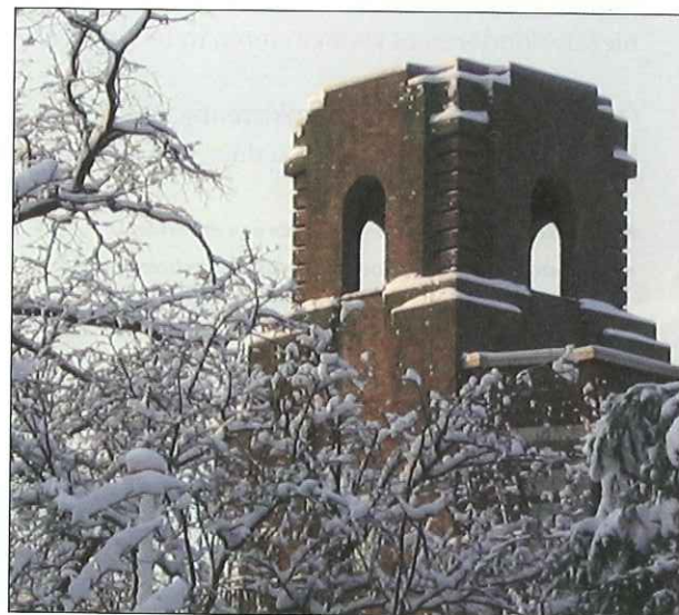
Torentje Duinwyck in de winter.