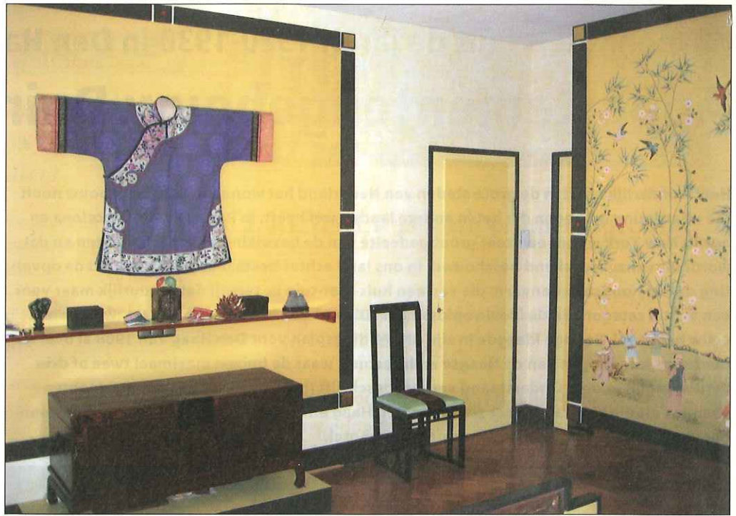
Slaapkamer (met het gele handgeschilderde zijdebehang).

Het complex was onderdeel van de prestigieuze opzet voor de nieuw te