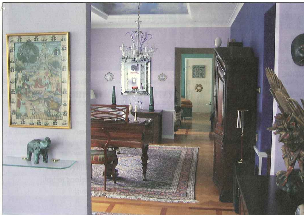
Doorkijk (of 'enfilade') door 3 woonkamers.

centrale verwarming en warm water via een eigen installatie (een bijzonderheid voor die tijd!) en de mogelijkheid tot het inhuren van personeel naar behoefte: een soort 'one hour service'. Dit alles was voor die tijd zeer vooruitstrevend. Iedere flat had zijn eigen badkamer, de grotere hadden er twee.