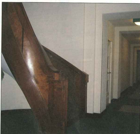
Ovaal trappenhuis op de begane grond, achter de hoofdentree Van Alkemadelaan.