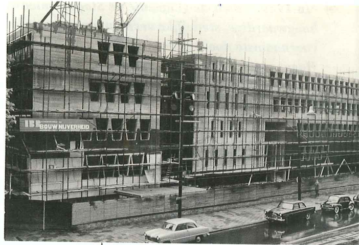
De Amerikaanse ambassade in aanbouw

Illustratief is de recente brief van het Haags Monumentenplatform, waarin ook de Vrienden vertegenwoordigd zijn. Het platform kon niet tot een unaniem oordeel komen, maar is in meerderheid voor behoud en bescherming van het gebouw. De brief pleit tevens voor een zinvolle herbestemming, een toegankelijke publieke functie. De daarvoor eventueel benodigde aanpassingen aan