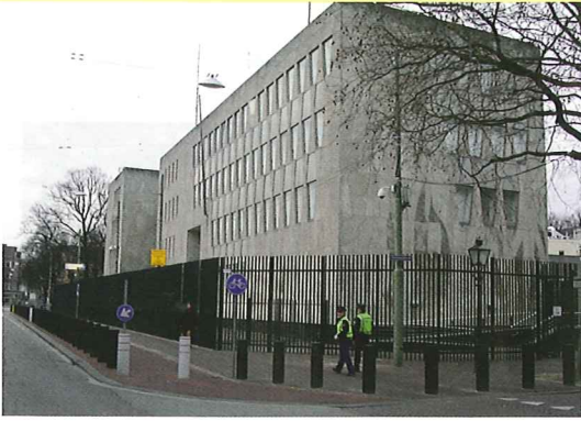
De Amerikaanse ambassade zoals die tegenwoordig is afgeschermd van de stad.

De Amerikaanse ambassade in Den Haag in 1960. Als de huidige veiligheidshekken rond de ambassade zijn verwijderd komt het kenmerkende gebouw weer beter tot zijn recht. Alleen de auto's van 1960 zijn gedateerd, maar niet minder fraai.