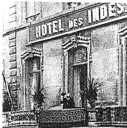
Paul Kruger in 1890 op het balkon van Des Indes