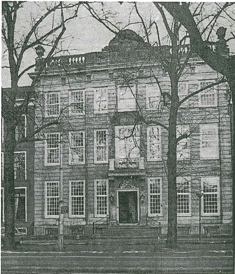
● Huize Schuylenburch aan de Lange Vijverberg 8.