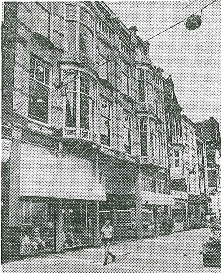
• De gevel van de voormalige theesalon Krul, Noordeinde 44