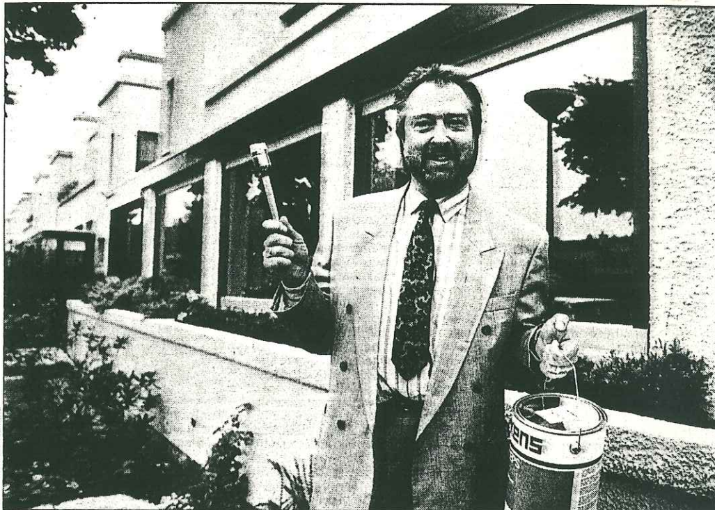
Schilder A. Meerbeek: „Zo'n boeiend project als de Papaverhof maak je maar één keer in je leven mee”.