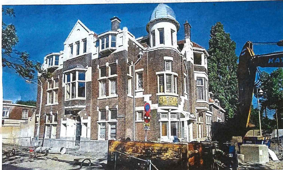
▲ Het voormalige bierdepot De Drie Hoefijzers aan de Zwetstraat. Onderzoek bracht hier verrassende zaken aan het licht.

De organisatie zorgt er al 40 jaar voor dat toonaangevende monumenten als distilleerderij Van Kleef, de brandweerkazerne in Scheveningen en de Julianakerk worden van de slopershamer. Maar bij het grote publiek is Stadsherstel nog onbekend.