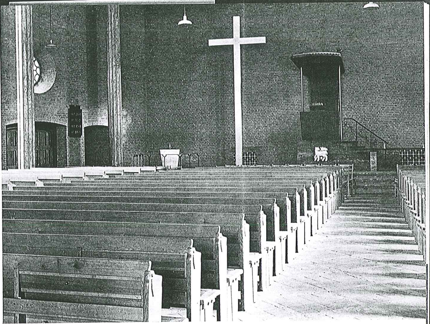
Het teken van Golgotha