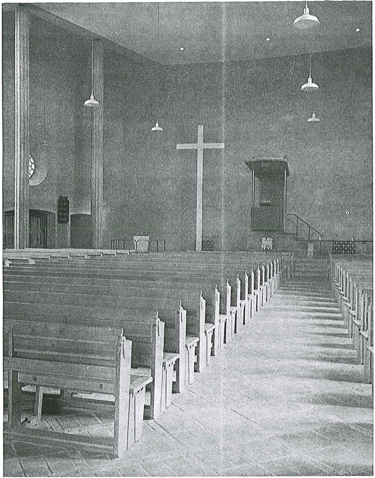
n.h. kerk te 's-Gravenhage | G. Westerhout

Maranathakerk te Oosterbeek | prof. F. A. Eschauzier