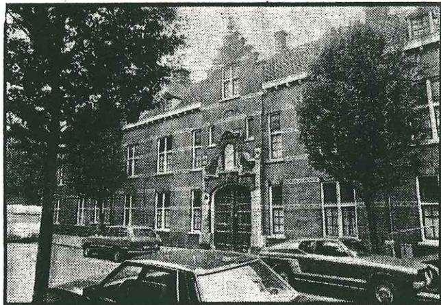
● Achter de poort een sfeer van bijna onwezenlijke stilte