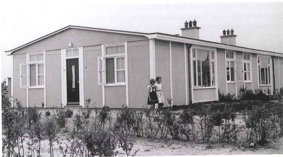
Barakken met woningen op Werkeiland Lelystad-Haven, 1955.

Na beide wereldoorlogen worden in hoog tempo woningen met enige zorg gebouwd, wat blijkt uit een expositie over de ontwerpen in 1918 en de woningen zelf in de Ericastraat, Amsterdam. Zo zijn verschillende typen noodwoningen (bijvoorbeeld Maycrete woningen) en zelfs tijdelijke boerderijen (bijvoorbeeld na de inundatie van Walcheren) tot stand gekomen. Deze worden zodanig gemeengoed, dat er zelfs een jeugdboekje 'Greetje uit de noodwoning' verschijnt. Ook