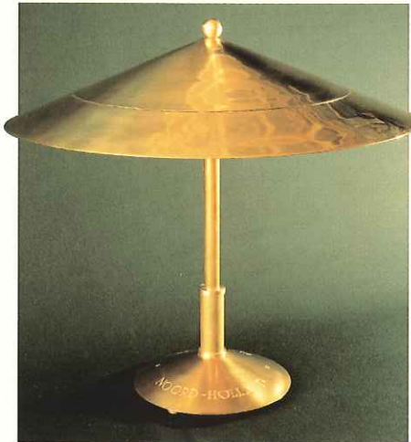
Een van de nieuwe zes messing tafellampen, geschonken door het Inter Provinciaal Overleg; ontwerp E.J. Nusselder

H et belangrijkste uitgangspunt van het restauratieplan was het respecteren van het oorspronkelijke zeventiende-eeuwse werk, tot op afwerkingsniveau. Een tweede restauratiebeginsel was het streven naar herstel van eenheid en rust in het interieurbeeld. Daarbij mikte men niet op feitelijke reconstructie, maar op heruitmontering in de geest van het oorspronkelijk concept. Een derde uitgangspunt was te proberen de balkons letterlijk en figuurlijk wat minder 'aanwezig' te laten zijn.