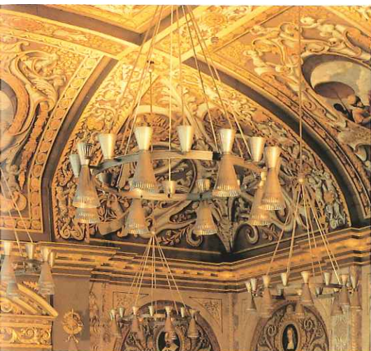
Kroonluchter, aangepast voor halogeen.

E en essentiële ingreep was het verbeteren van het binnenklimaat. Vanuit esthetisch oogpunt was herstel nodig in verband met restauratie van de plafondschildering. Dit bleek een uiterst lastige operatie, mede doordat vlak boven de plafond-delen, tussen de ribben, dunne planken op latjes waren aangebracht om stofvorming tegen te gaan.