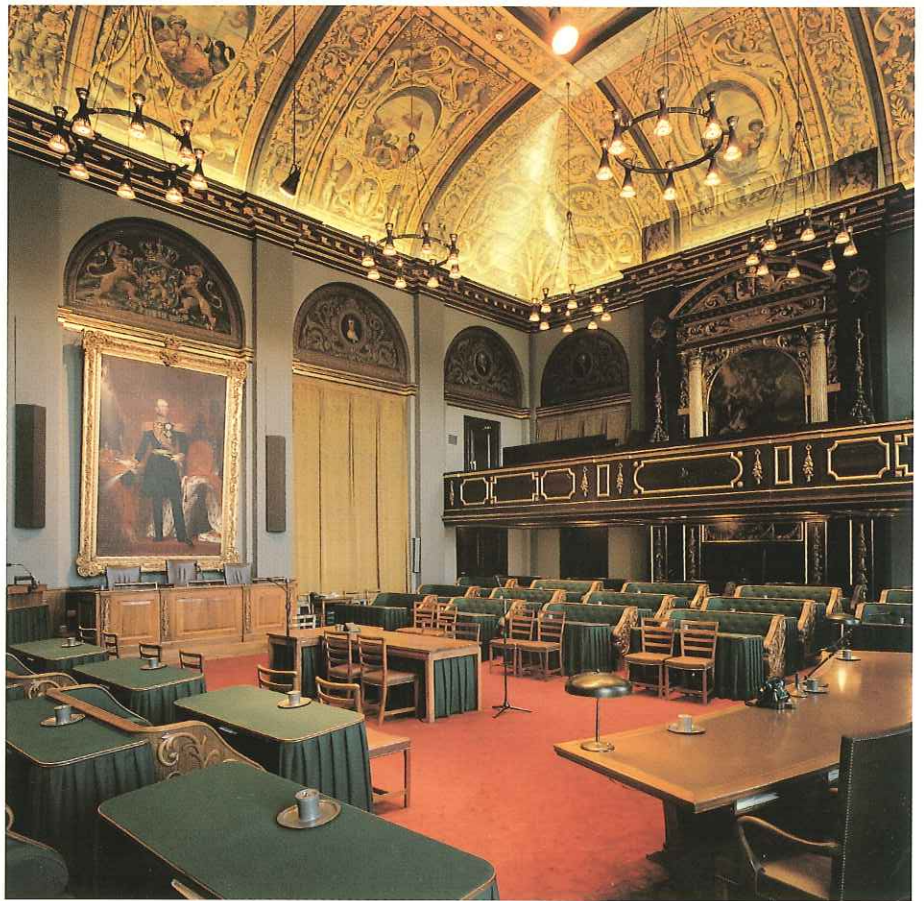
Overzicht van de zaal vóór restauratie. De oude verlichting is aan; door het TL-licht boven de kroonlijst wordt het plafond 'losgesneden' van de wanden.

Eind jaren tachtig werd renovatie echter actueel. Begin jaren negentig werd besloten een renovatieplan op te stellen voor de verbetering van de plenaire Zaal. Hiermee kon de Zaal zowel in technische als esthetische zin opgeknapt worden.