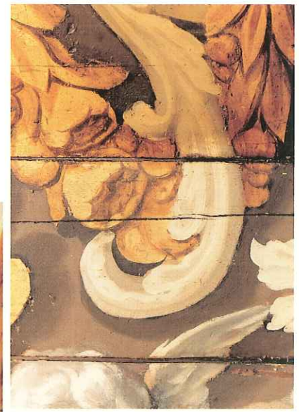
Detail van de gedeeltelijk schoongemaakte ornamentschildering in het plafond. De opheldering van de licht-grijze partijen is frappant

met oplopende podia, waarop een paarsrode vloerbedekking met de Nederlandse leeuw als motief. De nieuwe tweezitsbanken werden met groene stof bekleed. Het rostrum voor het presidium, de ministers- en stenografentafel werden alle vernieuwd. Bij de huidige restauratie is de inrichting uit 1956 grotendeels gehandhaafd, net als de vloerbedekking. Wel is het rode tapijt rondom 'losgesneden' van de wanden door middel van een brede rand van ruige, houtkleurige 'matting'.