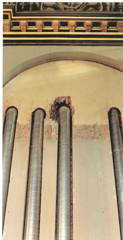
Ingesleufde verdeelleidingen voor de luchtbehandeling van de zaal.

een optimale, continue geluidsverbinding met de verschillende ministeries en voor een goede geluidskwaliteit voor radio en tv. In de bankjes van de kamerleden zijn aansluitingen aangebracht voor een vertaal- en discussie-installatie. Duurzaam bouwen, het gebruik van milieuvriendelijke materialen en een vermindering van energieverbruik, vormde een belangrijk uitgangspunt bij de restauratie. Dit komt onder andere tot uitdrukking in de verbetering van het binnenklimaat. Andere elementen zijn de vermindering van het energieverbruik door afgestemde verlichting en de toepassing van een zogeheten "warmtewiel" voor de terugwinning van warmte. Er is zoveel mogelijk gebruik gemaakt van bestaande materialen. Waar vernieuwing noodzakelijk was en waar dat kon zijn milieuvriendelijke producten en materialen toegepast, zoals lijnolieverven. De asbestbekleding in de lichtkoven en radiatoren is verwijderd.