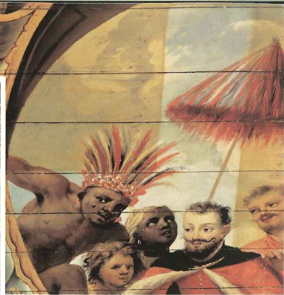
Opname van de middelste cartouche van de zuidflank van het plafond. Gedeeltelijke reiniging laat het verschil tussen vóór en na de behandeling zien, overzicht en detail.

kunst recht gedaan. In 1884-88 waren de twee grote schoorsteenstukken uit 1664 'Oorlog' door Lievens en 'Vrede' door Hanneman uitgenomen en gerestaureerd. De opvallende schilderstukken zijn nu vakkundig gereinigd, licht gerestaureerd en van een slotverniss voorzien. De acht portretten van raadpensionarissen en het landschap met de schildhoudende leeuwen werden eveneens schoongemaakt. Het laatste punt betreft de inrichting van de Zaal. De grondwetswijziging van 1956 bracht het aantal leden van de Eerste Kamer op 75. Dáárvoor was het ledental 50. Om aan iedereen ruimte te bieden moest de indeling worden gewijzigd en moesten de vergaderbanken worden aangepast. Er kwam een compleet nieuwe vloer