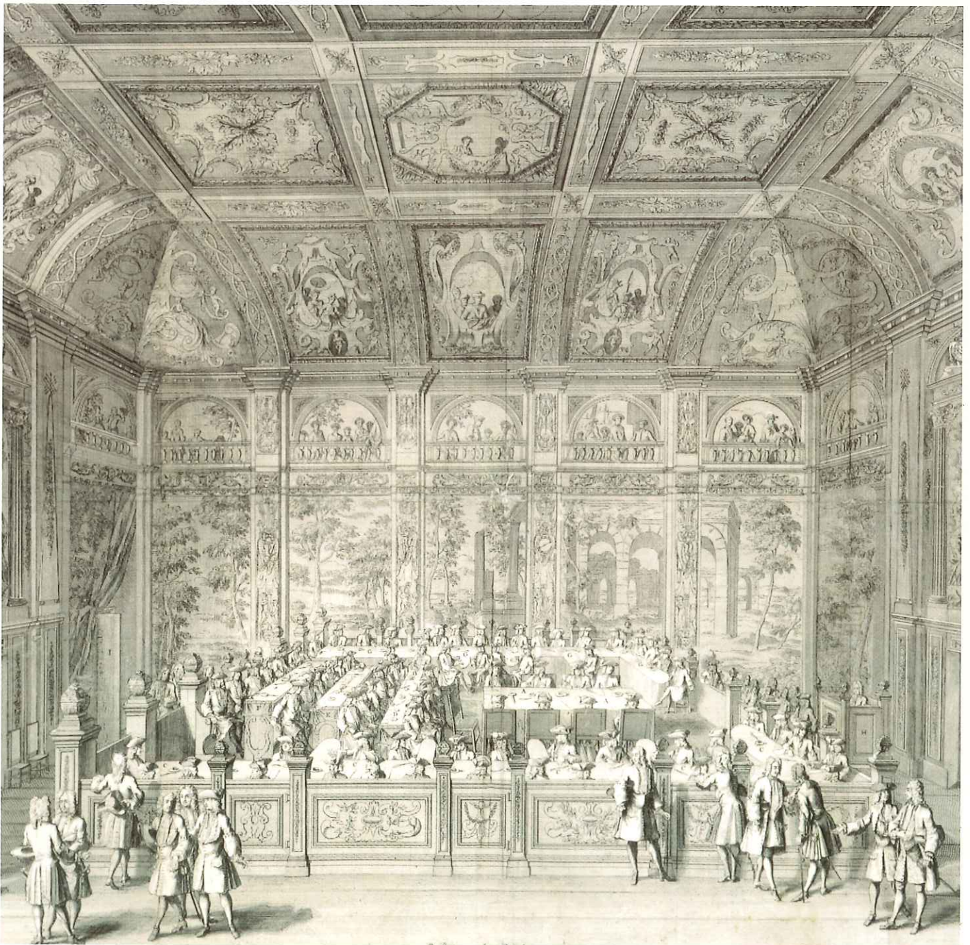
Gravure naar tekening van Terwesten en Van Giessen van het interieur van de grote vergaderzaal van de Staten Van Holland en Westfriesland, gezien naar het zuiden, omstreeks 1730.

Het landswapen kreeg de ereplaats in de middelste boog, boven het portret van Koning Willem II. De wettelijk verlangde openbaarheid bracht verder met zich mee dat er zitplaatsen kwamen voor publiek. In 1870 werden de bestaande, gelijkvloerse zitplaatsen vervangen door verhoogde tribunes op ijzeren kolommen. Deze werden geplaatst tegen de korte wanden. In 1881 zijn de tribunes vervangen door, nu nog bestaande, balkons over de volle breedte van de zaal.