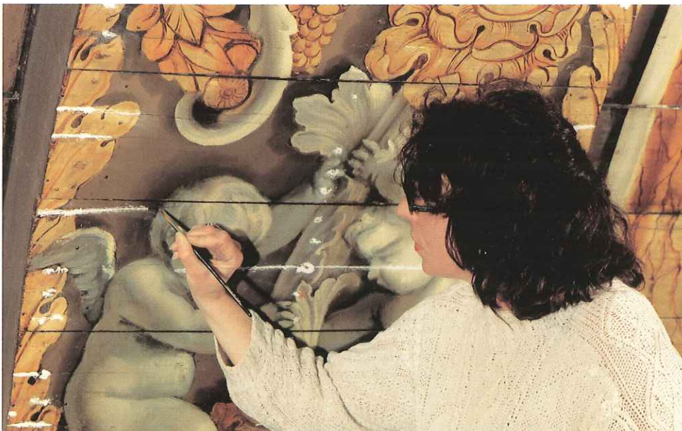
Het retouchewerk aan de gewelfschildering in volle gang.